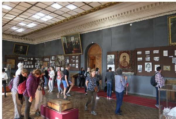
Excursiedag: klooster bij Mtskheta en Stalin-museum in Gori. Georgië is prachtig en intrigerend!

Arja, 03 12 18 - arjavanveldhuizen@gmail.com