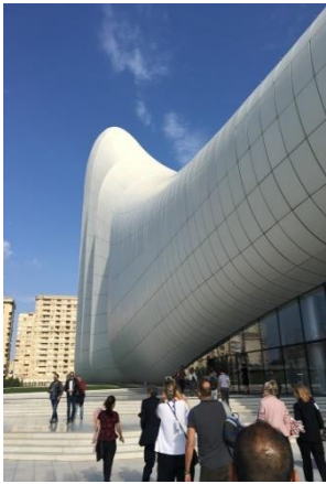
Heydar Aliyev Center

begonnen met een olieveld. Dit bedrijfje groeide onder de naam Branobel uit tot een wereldwijd werkende oliegigant totdat de Russen alles confisqueerden in 1918.