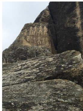
Gobustan-rotstekeningen· Met de gids op de foto