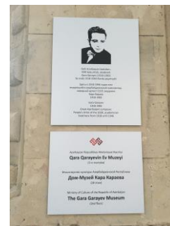
National Museum of History Memorial Museum of Bulbul Museum of Gara Garyev