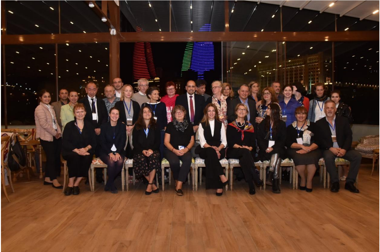
Groepsfoto ICDAD-DEM HIST JOINT CONFERENCE AZERBEIDZJAN 2018