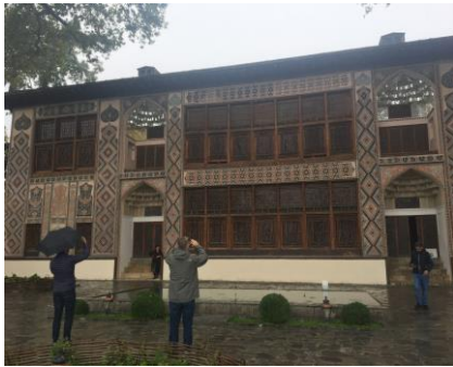
Het paleis van de Shaki Khans

Op 13 en 14 oktober konden we deelnemen aan een excursieprogramma buiten Bakoe. Ik koos op 13 oktober voor de excursie naar Shaki in het Noordwesten van Azerbeidzjan waar we het fraai beschilderde paleis van de Shaki Khans (18 e -19 e eeuw) bezochten, de Kish-kerk; een van de oudste Romaanse kerkjes in Azerbeidzjan en een mooie Karavanserai, nu in gebruik als hotel. Ondanks het koude en zeer natte weer was het een indrukwekkende dag door een fraai landschap.