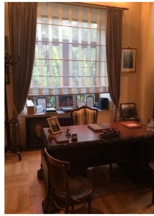
Villa Petrolea (Nobel-brothers)

Het laatste onderdeel van de middag: een bezoek aan de CHELEBI showroom, waarin jonge designers hun producten kunnen verkopen, hebben we moeten overslaan om nogmaals tijd te kunnen hebben voor een bestuursvergadering waarin ondermeer de nieuwe website en het activiteitenprogramma van de nationale demhist-comités op het programma stond.