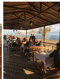
Lunch aan de zee

Tot slot: ik ben ICOM-NL dankbaar dat ik deze conferentie met een reisbeurs kon meemaken. Azerbeidzjan en Bakoe waren openbaringen. Rijk aan cultuur, erfgoed en landschap, met een bijzonder gastvrije bevolking en een fijne keuken. De conferentie heeft mij veel geleerd over de Azerbeidzjaanse tapijtkunst, ook de andere presentaties van zowel ICDAD als Demhist waren inspirerend en leerzaam. Als DEMHIST-bestuur hebben we intens vergaderd, dat was nodig en belangrijk. Deze conferentie heeft dan ook bijzonder veel bijgedragen aan kennis, bewustzijn, samenwerking, collegialiteit en inspiratie met, tussen, voor en door museumcollega's van over de hele wereld.