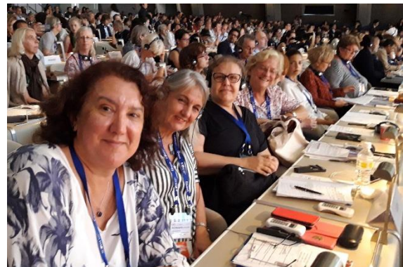
Tijdens de ICOM Extraordinary General Assembly, rechts de CECA tafel

Uiteindelijk is het zover: op 7 september om 9.30 uur start de Extraordinary General Assembly waarin wordt besloten over de nieuwe definitie. Dat is een bizarre ervaring. Er is een uur voor uitgetrokken, maar het duurt tot halverwege de middag. Ik zit ergens bovenin de stampvolle zaal, totdat ik een lawine aan berichtjes binnenkrijg op mijn telefoon omdat ik beneden hoor te zitten met een stemkastje om voor CECA te stemmen. Verrassing! (meestal zitten tijdens General Assemblies alleen voorzitters en secretarissen in de bankjes achter de naambordjes).